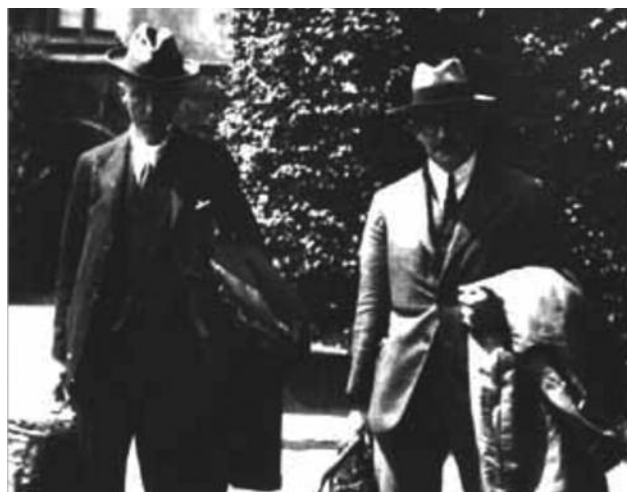
Hardy y Littlewood