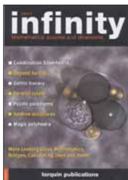
INFINITY. MATHEMATICAL PUZZLES AND DIVERSIONS Tarquin publications ISSN: 1748-3220