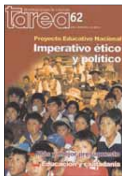
TAREA. REVISTA DE EDUCACIÓN Y CULTURA Asociación de Publicaciones Educativas Lima (Perú) ISSN: 0252-8819