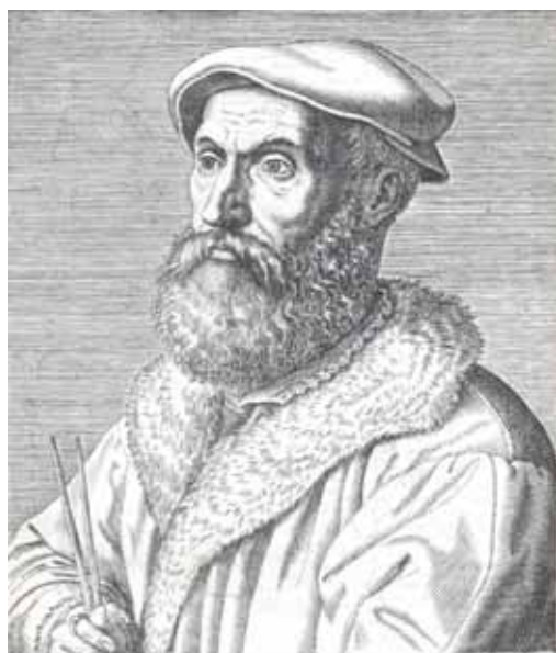
NICOLAUS TARTAGLIA, BRIXIANVS.

MORENO CASTILLO, R. (2001) Andanzas y aventuras de las ecuaciones cúbica y cuártica a su paso por España . Ed. Complutense, Madrid.