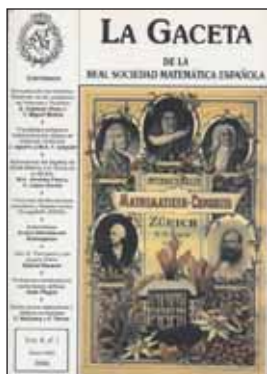
LA GACETA DE LA RSME RSME ISSN: 1138-8927