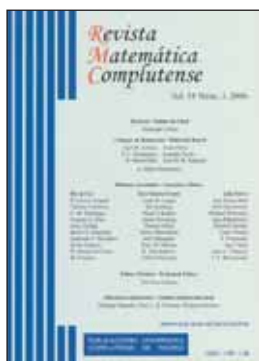
REVISTA MATEMÁTICA COMPLUTENSE S.P. UCM, Madrid ISSN: 1139-1138