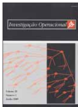
INVESTIGAÇÃO OPERACIONAL Associação Portuguesa de Investigação Operacional (APDIO) ISSN: 0874-5161