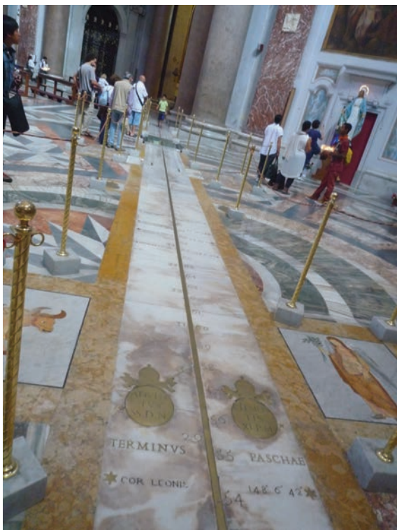
Figura 3

Hacia el centro de la línea se pueden observar dos elipses y dentro de ellas dos pequeñas reglas de bronce graduadas; estamos en el núcleo duro del