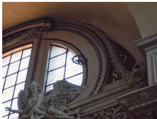
Figura 7. Foro de la meridiana boreal