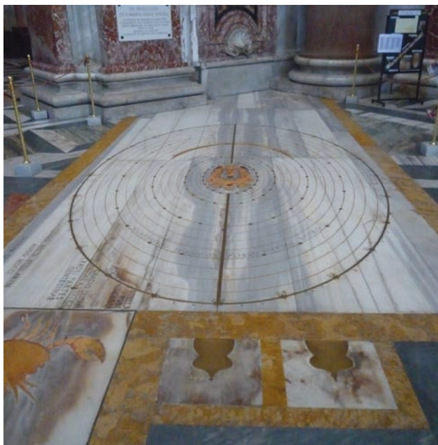
Figura 6. Meridiana boreal

Ahora viene la sorpresa: hay otra línea meridiana en la iglesia. Nuestro planeta no es una esfera perfecta y por ello, su rotación diaria provoca un pequeño «bamboleo» del eje. La meridiana boreal refleja las elipses descritas por la estrella polar alrededor del eje de la Tierra, desde el año 1700 hasta el 2500, a intervalos de 25 años. Tras la remodelación de la iglesia en 1750, la meridiana boreal ya no está operativa. Pero pueden observarse las elipses, cerca del pie de la meridiana austral, junto al muro sur. Desde ahí, mirando hacia el norte, en la parte curva del ventanal que corona el altar actual, se puede ver suspendida una corona de latón con una cruz en su interior. El orificio rectangular de esa cruz era el foro de la meridiana.