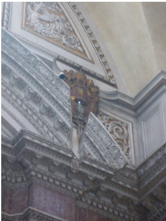
Figura 2. Foro de la meridiana

A lo largo de 365 días, el sol recorre dos veces la línea meridiana: en sentido sur-norte del 21 de junio al 21 de diciembre, y en sentido contrario del 21 de diciembre al 21 de junio del año siguiente. Debido a la inclinación del suelo de la iglesia respecto a la eclíptica, la imagen (corte del cono de luz con el plano del suelo) va ganando excentricidad: casi una circunferencia en el solsticio de verano ( 21\text{cm} \times 20\text{cm} ) hasta una elipse clara ( 110\text{cm} \times 46\text{cm} ) en el de invierno. Las representaciones de las constelaciones que flanquean la línea, seis de subida y seis de bajada, indican la casilla del zodiaco en la que se encuentra el sol en ese momento. Los preciosos dibujos están realizados mediante incrustaciones de mármoles de muchísimos tipos, en los que se han fijado —con su posición real— estrellas de latón de tamaño variable (dependiendo de la magnitud) [Actividades 4, 5, 6 y 7].