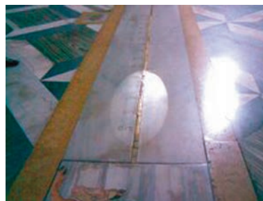
Figura 4. 21/12/2008. Solsticio de invierno