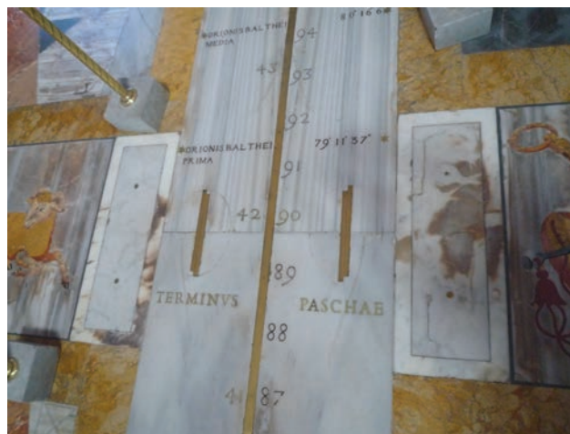
Figura 5. Regletas para determinar la entrada en primavera