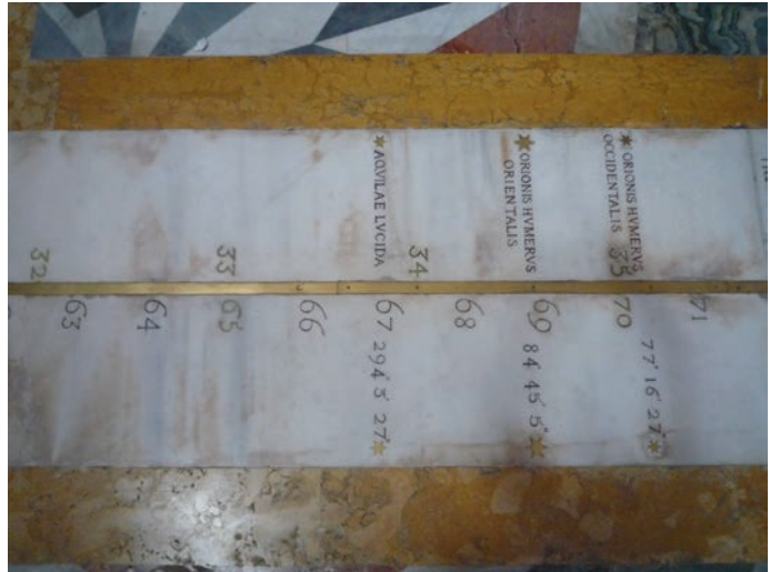
Figura 8.

¿Cuál es la distancia d desde la marca angular 33 hasta el muro? Para ti, es fácil averiguarlo (¡hazlo!). Cuando se construyó