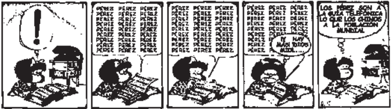
Figura 6. Mafalda y la lista de teléfonos