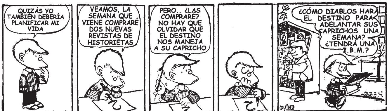
Figura 3. Quino, Felipe y el destino