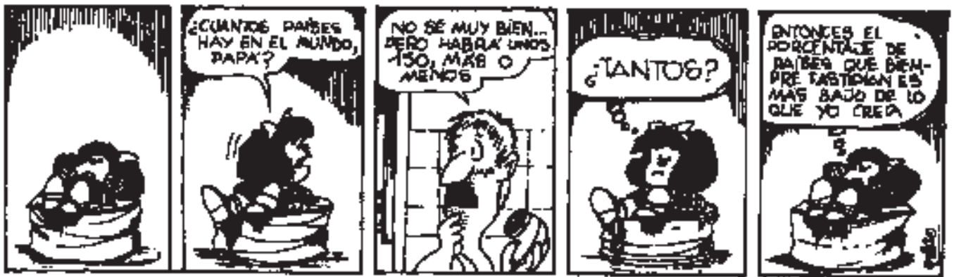
Figura 7. Mafalda y los países

dada. Pero ¿son igualmente azarosos los fenómenos referenciados? Para estudiar esto sugerimos las siguientes cuestiones: