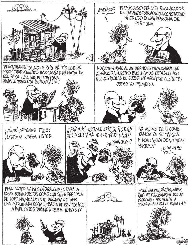
Figura 2. Quino, la inspección de hacienda y la fortuna

Un aspecto importante lo constituye la creencia en el azar que algunos individuos profesan, por ejemplo: al apostar en la lotería al número que no ha salido, suponiendo que ya es hora de que salga; creer que hay números del dado que salen más que otros; creer que el resultado obtenido depende de la forma en que se tire el dado o se barajen las cartas, etc. Para rebatir estas creencias, es necesario insistir, en nuestra enseñanza, sobre el concepto de azar y las creencias que tienen nuestros alumnos, ligadas a éste concepto. Más allá de dar definiciones formales, es necesario lograr desarrollar actitudes correctas hacia el azar, que consideren sus limitaciones y adviertan sobre las ventajas y