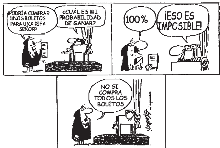
Figura 9. Seguridad de ganar

Al enseñar probabilidades en la educación obligatoria, es importante, resaltar que para su utilización adecuada hay que indicar los recursos necesarios, el grado de certidumbre al dar un resultado y el marco de referencia que abarcan las conclusiones, tal como vemos aparece en la historia de la figura 9, que nos permite volver a insistir en el interés que tiene el empleo de las viñetas humorísticas para la enseñanza y aprendizaje del azar y la probabilidad. En ella se pueden hacer las siguientes cuestiones: