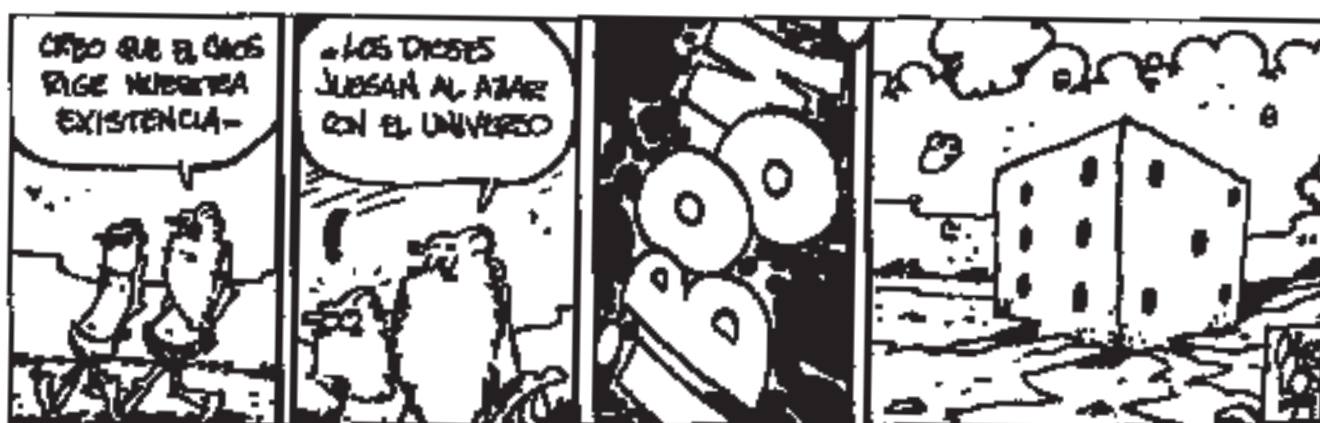
Figura 1. Viñeta Orceman

En la viñeta de la figura 2, la administración hace uso del azar para tomar decisiones, mediante algo más que el juego de palabras (azar = fortuna). Puede parecer un rela-