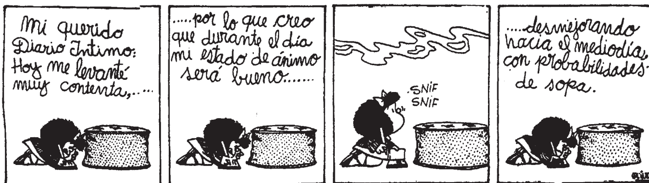
Figura 5. Mafalda y probabilidad de sopa

grados de creencia, pero que son en realidad grados de conocimiento... Por grado de probabilidad significamos realmente, o debemos significar, grados de creencia... Probabilidad se refiere entonces, e implica, creencia, más o menos, y creencia no es más que otro nombre del conocimiento imperfecto, o puede expresar el estado de la mente en conocimiento imperfecto. (De Morgan, 1847, citado en Gutiérrez, 1992, p. 293).